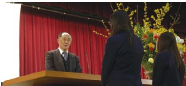
三世代賞 受賞の様子

購読後に感想やご意見、また励ましのお言葉等を頂戴できれば幸いです。皆様からお寄せいただいた「声」を可能な限り反映させて発信してまいりたいと存じます。どうぞ、この会報誌「桜朶(OU DA)」を末永く愛していただき、同窓の絆として大きな輪として広がっていくことを夢見ながら、ご挨拶いたします。