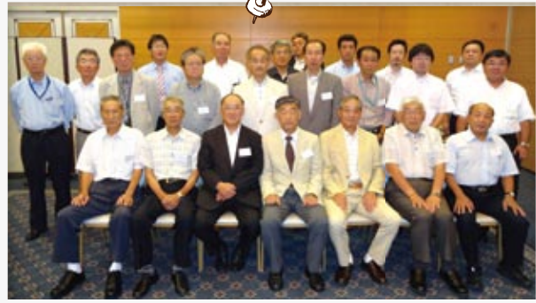
県南支部総会・懇親会 7月6日(土) ホテルサンルート白河