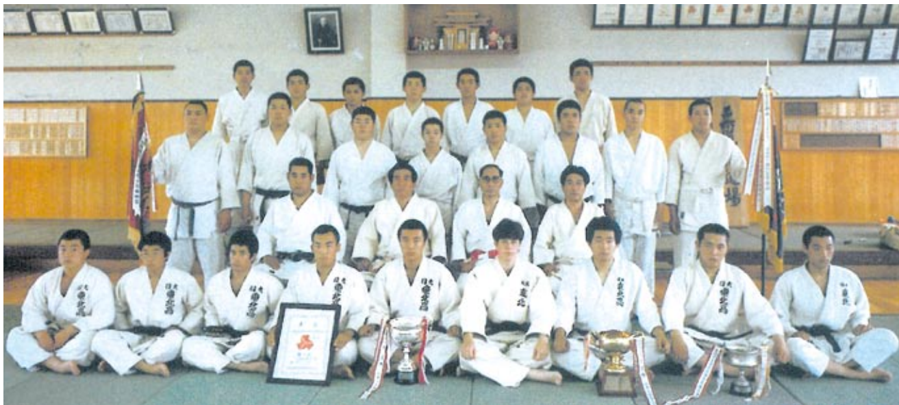
当時の柔道部(第29期卒業アルバムより)