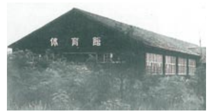
昭和27年頃の体育館