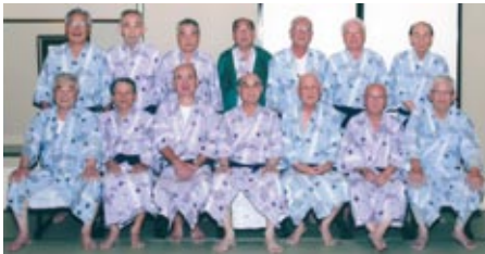
日本東北高等学校機械科1組クラス会 平成24年10月19日 於:陽日の郷 あつま館

ところで、我々の入学時の母校の教育環境は創立間もないこともあり、物的には十分とは言えないものでした。しかし、我々にとってのこの3年間は、何ものにも代えがたい人間形成と級友との強い絆づくりの期間だったと思います。避けることの出来ない年齢の問題はありますが、今後も会員の絆の確認と、この会への継続参加を「目標」として続けていきたいと思えます。