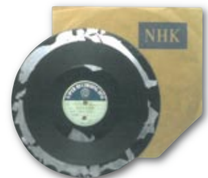
昭和30年6月1日録音のレコード原盤

二杯の支那ソバで東北高校を選んだことは、私にとって最高の選択だったのです。東北高校、ありがとうございます。感謝。