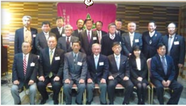
須賀川支部総会・懇親会 3月21日(木) ホテルグランシア