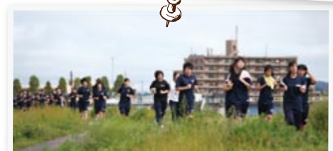
校内マラソン大会