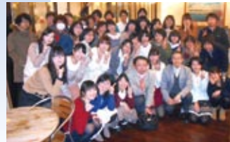
平成25年3月9日(土)PM18:00 レストラン「ウイングガーデン」

先生方は一次会のみに参加でしたが、二次会以降は私達だけで、より互いの深い話に花を咲かせることができました。私は仕事の都合上途中で帰宅しましたが、残りのメンバーはなんと四次会(?)まで楽しんでくれたようです。みなさん、またお会いしましょう!