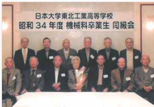
2016年10月23日 於：郡山ビューホテルアネックス