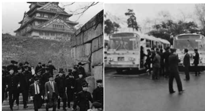
思い出の旅 関西旅行

て点呼があって、自由時間は夜だけでした。京都の新京極辺りから生まれた生徒もいたようで。都会ではウチあたりはかわいい部類でしたよ。