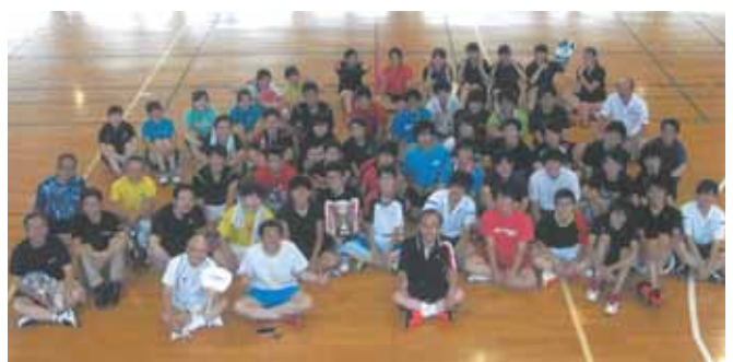
2016年大会終了後記念体育館にて