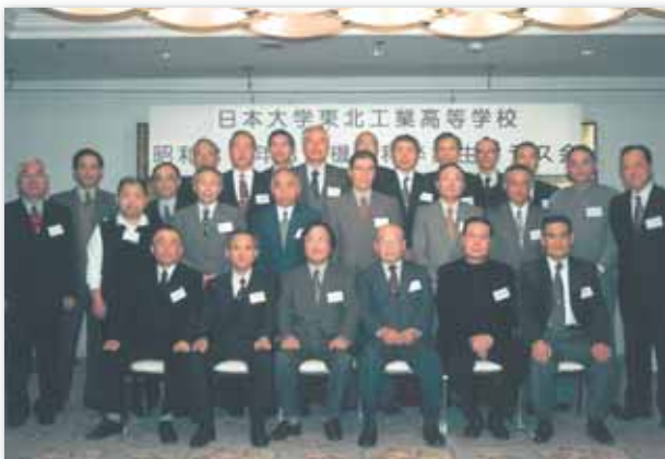
2000年11月25日 於：郡山ビューホテル