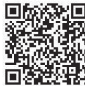
福島県HP QRコード 「雲のかなた」音源

平成29年3月6日(月)に、福島の今や想いを多くの人へ伝えるための歌『雲のかなた』の披露会が行われました。歌手の谷村新司さんが作詞作曲を手掛け、本校合唱部が収録と初演を担当しました。