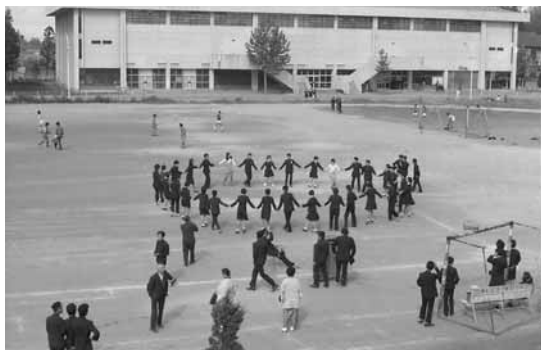
第1回アカシヤ祭開催