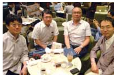
上野駅にて東京在住の拡大同窓昼食会 平成28年7月10日