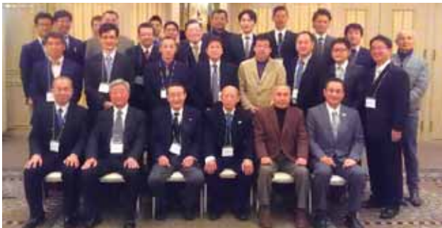
平成29年1月15日 於:郡山ビューホテル

本校の陸上競技部の同窓会にあたる「日大東北高校陸友会総会」が開催されました。同会は現在2年に一度、陸上競技部の近況報告、OB・OG会員の近況報告を目的に開催され、懐かしい顔ぶれが集まり親睦を深めています。同世代の卒業生の同窓会としての価値だけでなく、世代を超えた陸上競技部の先輩や顧問との交流の機会として、再来年の総会にはより多くの卒業生が集まることを願っています。