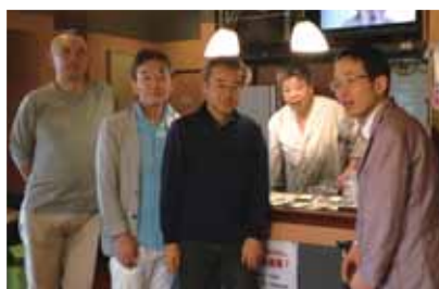
安積町チャイニーズキッチンみなみにて福島在住の同窓昼食会 平成28年9月23日