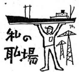
私の恥場 (4) 日本鋼管所 鶴見造船所 (二期機械) 会 田 照 男

観衆の注視の下に、観望人のおふり下ろす銀の斧に、船首のクヌ玉が割れ、七色のテープの流るれの中から、十羽の鳩が飛び立つ、興奮の渦中を数万吨の船が二階に分離独立して、私の務める艦艇設計はまた機密保持等の関係で造船設計部の中でも孤立し