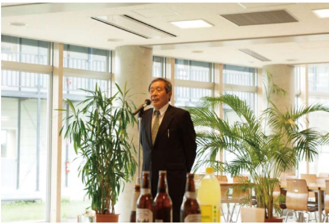
◆閉会の辞(宗像副会長)